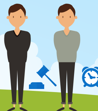
ЛИЦА, СОДЕРЖАЩИЕСЯ В ИЗОЛЯТОРАХ ВРЕМЕННОГО СОДЕРЖАНИЯ, СЛЕДСТВЕННЫХ ИЗОЛЯТОРАХ И ОТБЫВАЮЩИЕ НАКАЗАНИЕ ПО ПРИГОВОРУ СУДА