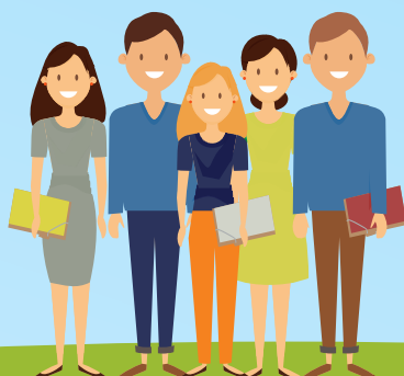
СТУДЕНТЫ КОЛЛЕДЖЕЙ, ПТУ, ИНСТИТУТОВ, УНИВЕРСИТЕТОВ, ОБУЧАЮЩИЕСЯ ПО ОЧНОЙ ФОРМЕ, А ТАКЖЕ ПОСЛЕВУЗОВСКОГО ОБРАЗОВАНИЯ