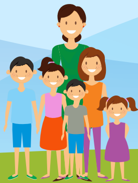
МНОГОДЕТНЫЕ МАТЕРИ, НАГРАЖДЕННЫЕ «АЛТЫН АЛҚА», «КҮМІС АЛҚА»