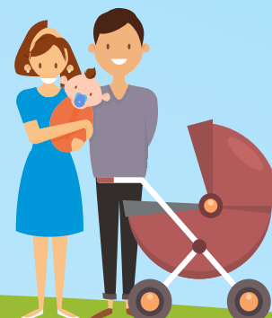
БЕРЕМЕННЫЕ ЖЕНЩИНЫ, ЛИЦА, НАХОДЯЩИЕСЯ В ДЕКРЕТНЫХ ОТПУСКАХ, ДО ДОСТИЖЕНИЯ РЕБЕНКОМ ВОЗРАСТА 3 ЛЕТ