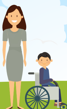
НЕРАБОТАЮЩИЕ, ОСУЩЕСТВЛЯЮЩИЕ УХОД ЗА РЕБЕНКОМ ИНВАЛИДОМ В ВОЗРАСТЕ ДО 18 ЛЕТ